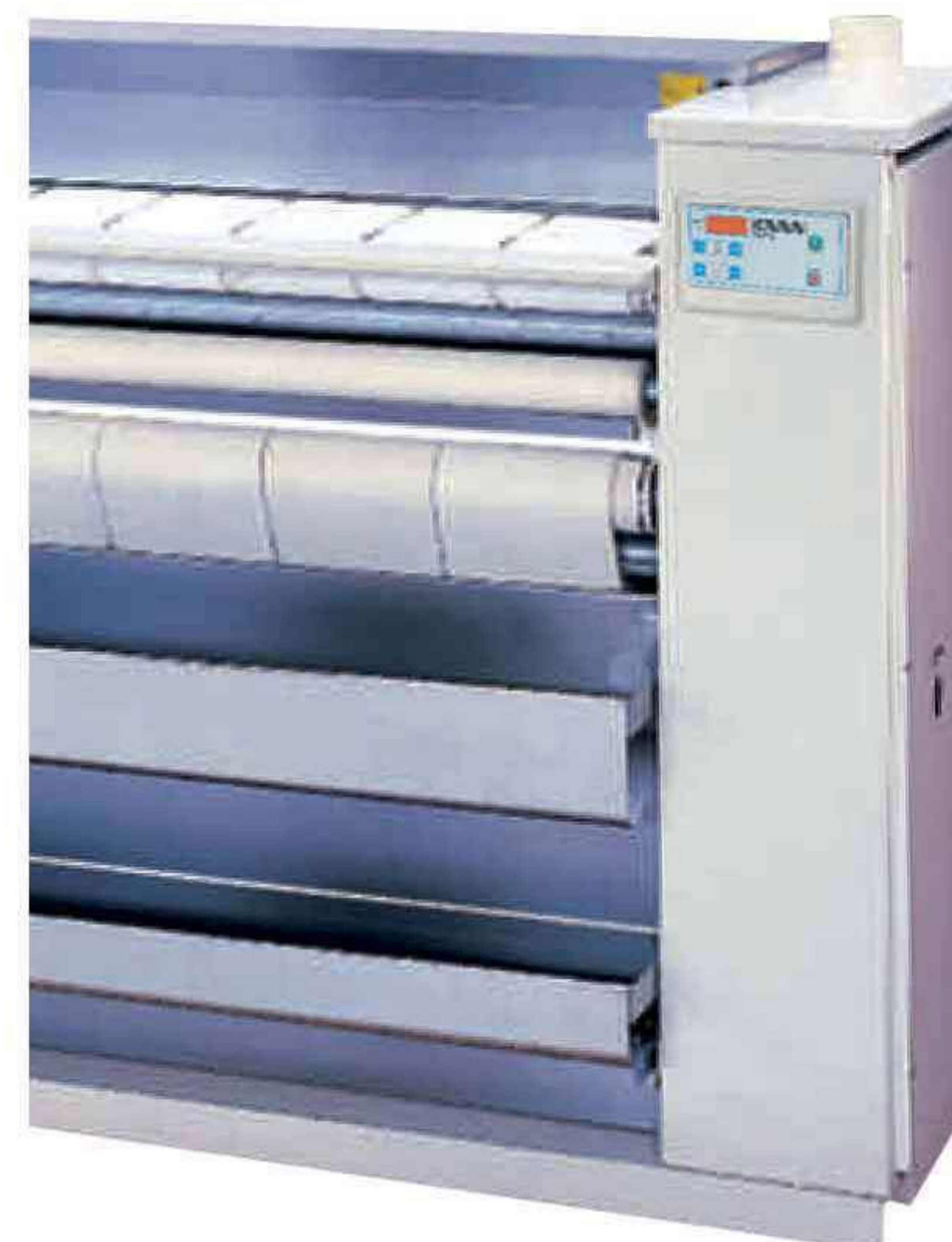
Серии K/M/G: модели, полностью оснащенные всем необходимым для эффективной и безопасной работы.