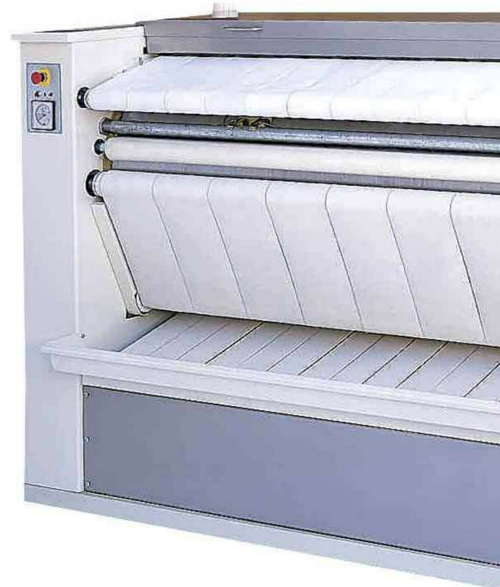
Серии MVR/GVR: модели класса люкс с возможностью выдачи белья с задней стороны

Адаптация оборудования к стандартным размерам коммерческого белья позволяет использовать вал каландра по всей его длине. Для высвобождения дополнительного пространства все наши «пристенные» машины могут быть установлены посты вплотную к стене!