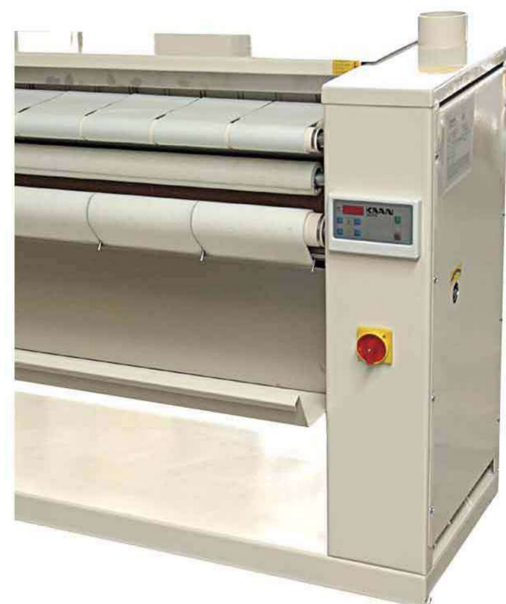
Серия Junior: компактные и эффективные модели

+ Предлагаемая система является оптимальным решением для любой современной прачечной, поскольку позволяет отказаться от использования центрифуги для белья и, в большинстве случаев, барабанной сушильной машины. Снижение расходов на содержание помещений и эксплуатацию оборудования, сокращение затрат, связанных со временем, энергией и рабочей силой, также благоприятно сказываются на общих расходах предприятия и гарантируют быструю окупаемость финансовых вложений предприятия.